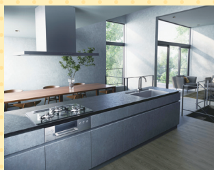
デリシア設置イメージ