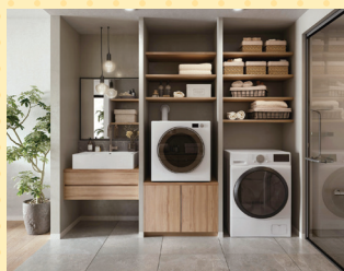
乾太くんデラックスタイプ設置イメージ